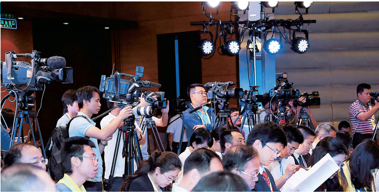
3月27日，博鳌亚洲论坛2015年年会各地媒体关注海南新闻发布会举行。

本次发布会吸引了160多名中外记者参会，到会采访的中央媒体有人民日报、新华社、光明日报、经济日报、中国日报、中央人民广播电台、中央电视台、中国新闻社等。到会的境外媒体有彭博社、塔斯社、读卖新闻、NHK、越南广播电视、朝日新闻、凤凰卫视、大公报、文汇报、澳门电台、澳门广播电视、澳门月刊、澳门新闻通讯社、美国中华商报等。