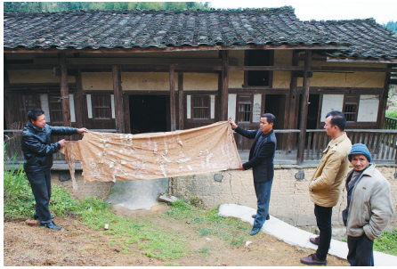
福建省大田县阳春村村民展示写有显化六全章公祖师字的布幔。

后来，守庙的单身老人松了口，他说有些事他只有到临终前才能说，不然他会倒大霉。人们一再追问，守庙的单身老人却闭口不谈。村民们看他年事已高，生怕把他逼出事来，而警方也未找到窃贼的踪迹。村民们自发组织起来到周围的乡村城市寻找佛像和有嫌疑的白色小汽车，但是几年寻求未果。这事就在村民的猜测中逐渐搁浅了。（来源：人民网）