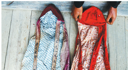
3月24日，福建省大田县阳春村村民展示“肉身坐佛”曾经穿过的衣物。

据福建省三明市大田县吴山乡阳春村村民介绍，当地传说章公祖师幼年随母改嫁至阳春村。小时候是个放牛娃，一次放牛时，受到高僧指点，成为一代得道高僧。皈依佛门后，他广结善缘，救苦救难，自己采集中草药，免费为周边村民治病，在当地拥有极高声望，北宋年间坐化。章公圆寂后肉身尚未腐烂之时，被镀金塑成佛像。从此，章公祖师的像便一直供奉在村中普照堂的正厅之上。阳春村多名村民回忆，章公祖师俗名章七三，法号普照，北宋年间圆寂后，被镀金塑成佛像，因真身的四肢和身首俱全，因此称为“六全祖师”。（综合新华社）