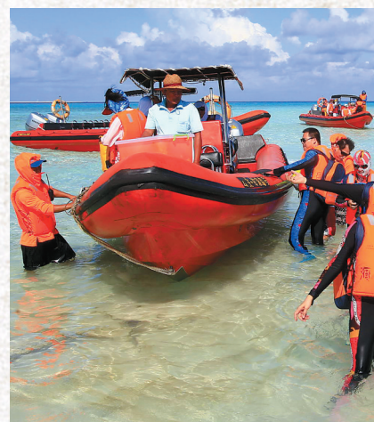
三沙的优美风光引来各地游客。

无论是政府工作报告提出的“南海资源开发服务保障基地和海上救援基地”，还是省政协建议案提出的“南海服务合作基地”，其核心都是立足南海，让21世纪海上丝路的海南梦想向那一抹蔚蓝深处进发！