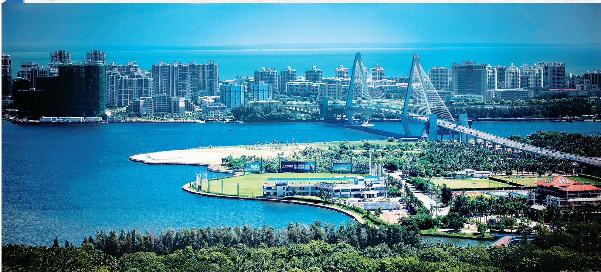
海口市海口湾、万绿园一带风光旖旎。

梦在穿越，心已达到。21世纪海上丝绸之路的“海南构思”，为新的征程擂响了前进的鼓点。