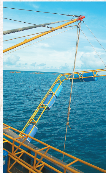
琼海潭门渔民利用机械进行深海养殖。