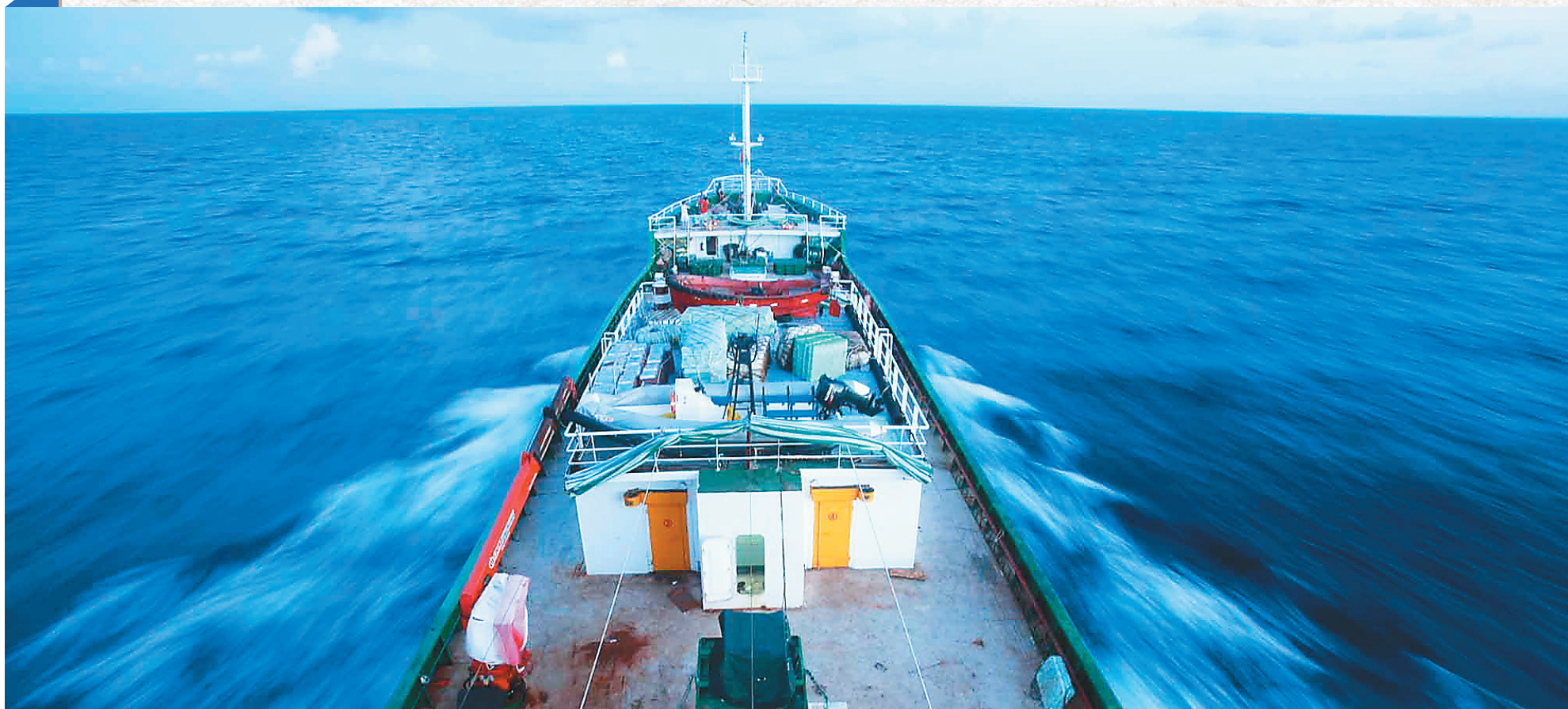
我省海洋渔业装备不断更新,进一步壮大了外海捕捞能力。图为「琼三亚」综合补给船。