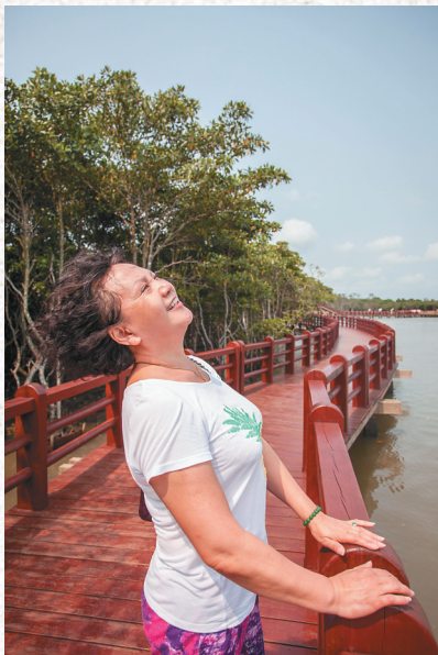
海口市演丰镇,东寨港红树林生态旅游区,一名来自吉林的游客一边欣赏红树林,一边深呼吸。

海南乡村游在节假日也大受追捧—— 2015 年春节 7 天假,海南全省乡村旅游共接待游客 66.41 万人次,收入 3.51 亿元,乡村旅游持续火爆