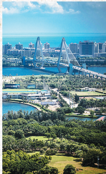
美丽的海口湾滨海风光。