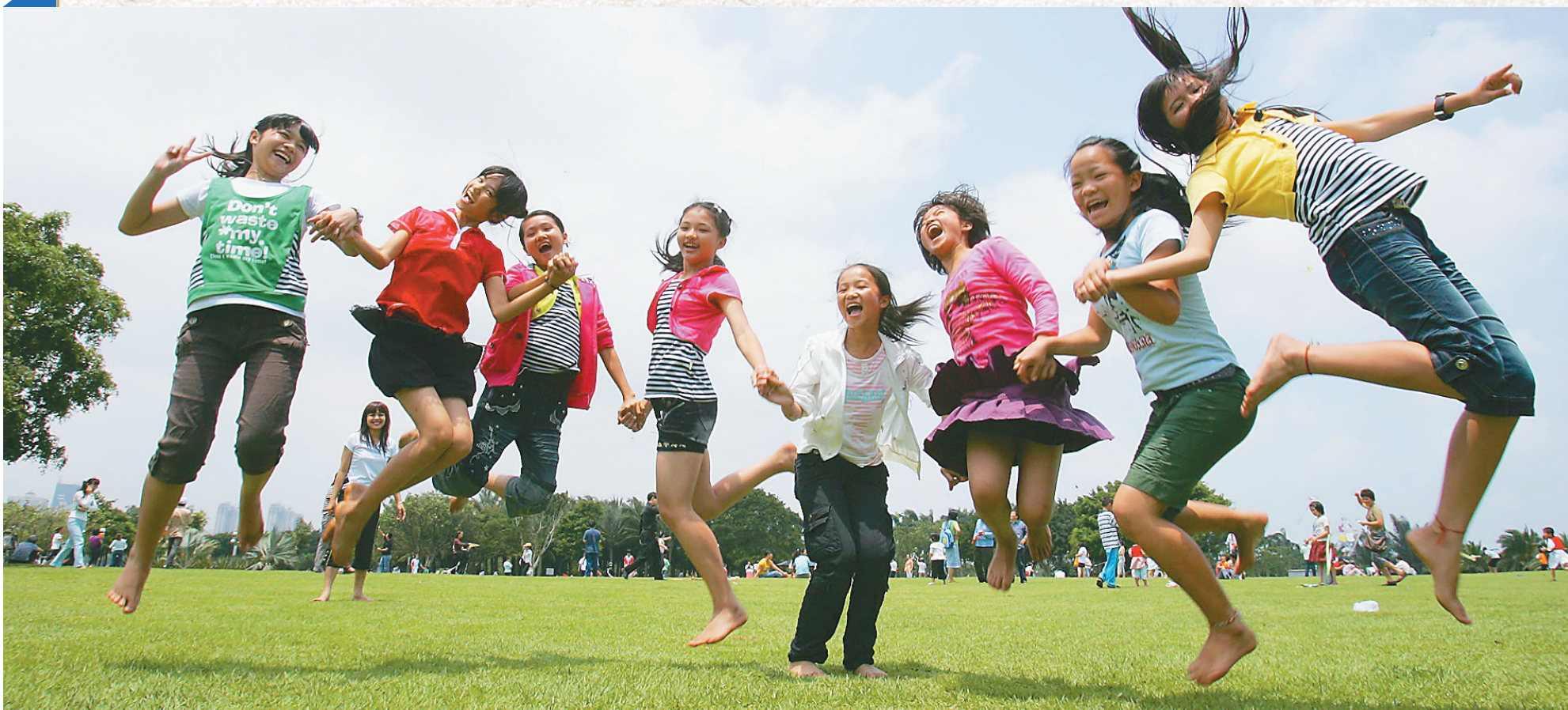
海口最大公共绿地——万绿园,是市民和游客养眼的好去处。