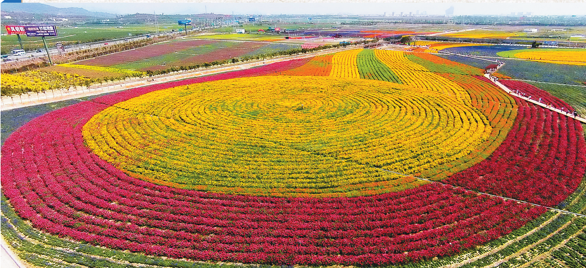
三亚凤凰花海丰富了游客的度假体验。