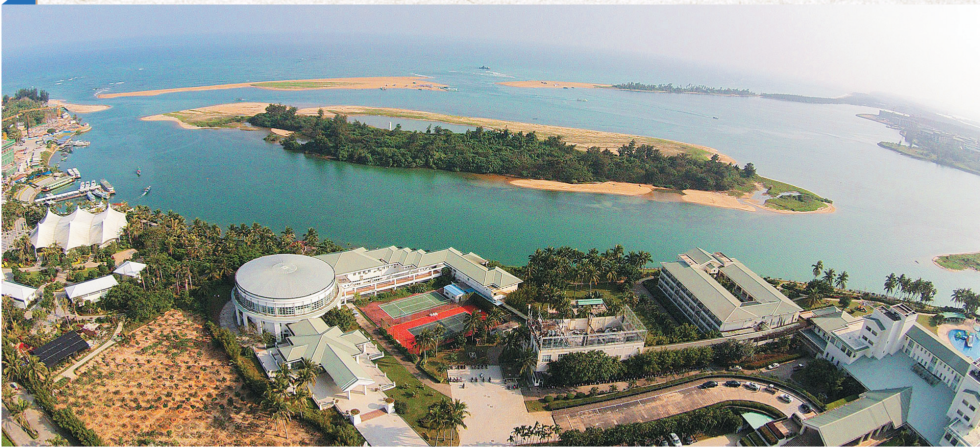
博鳌亚洲论坛周围的美丽景观。