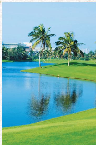
蓝绿相融,纯净优美的博鳌小镇美景。