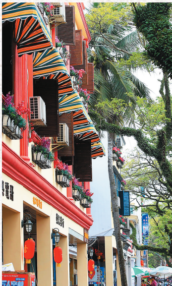
琼海中原镇街道两边的建筑极具南洋风格。