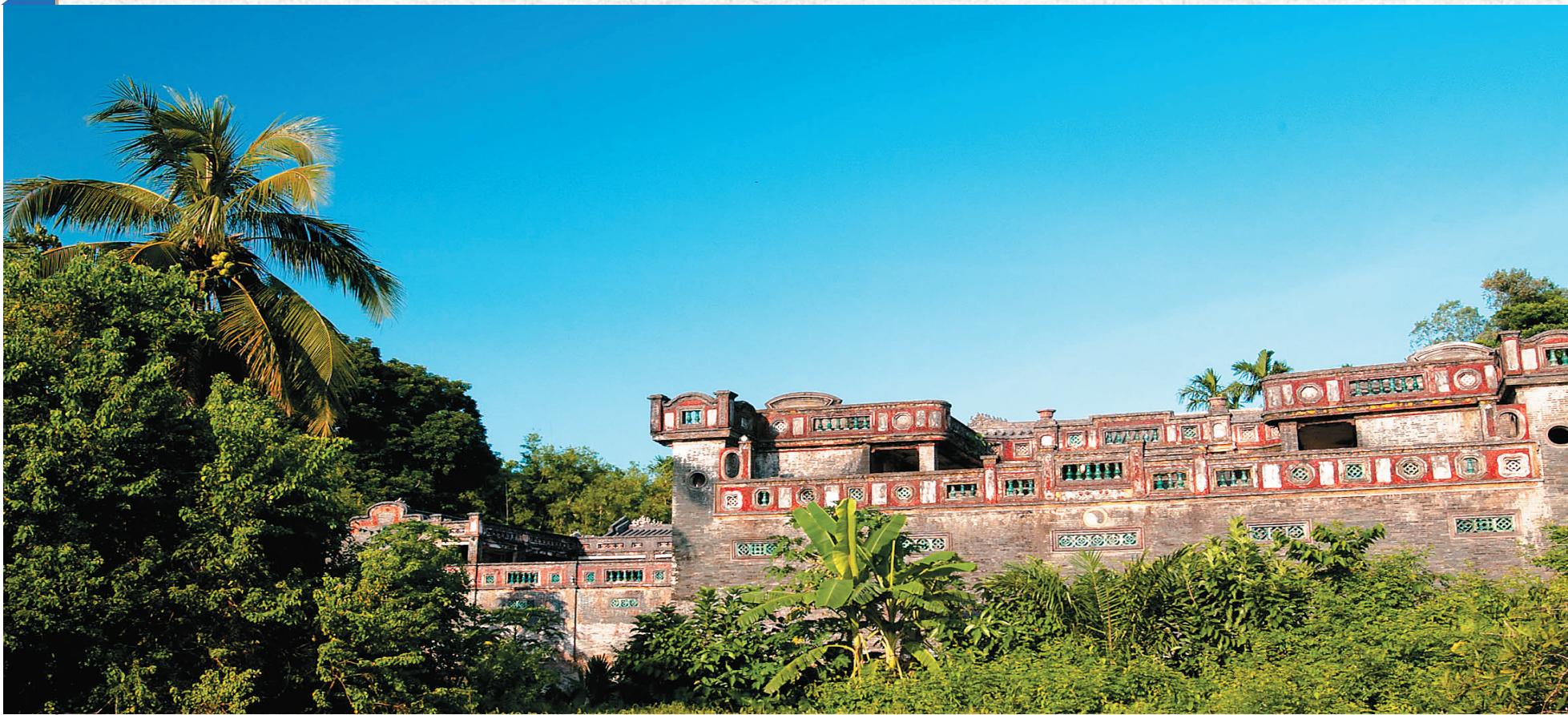
海南侨乡第一宅——蔡家老宅。