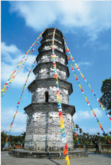
图为琼海塔洋古邑风情小镇景点。