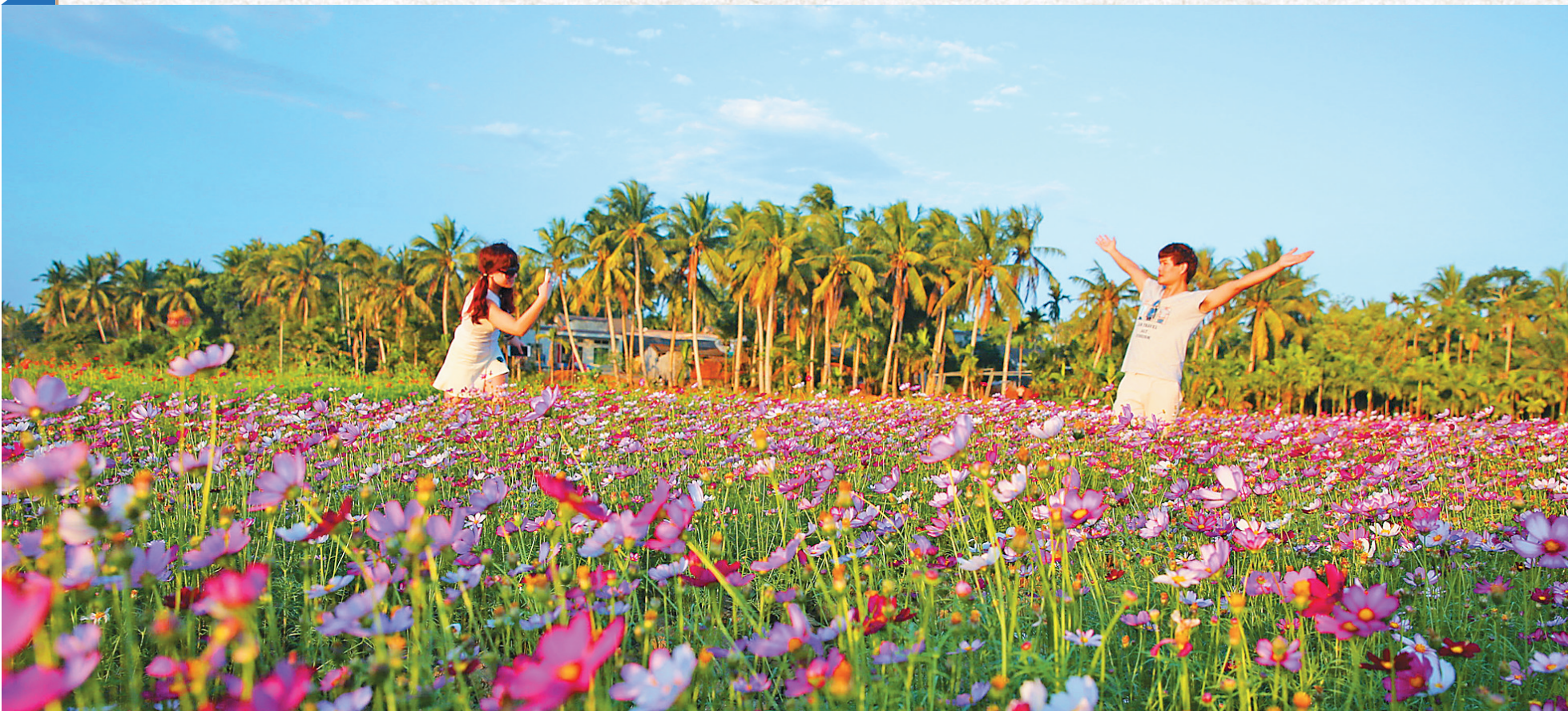
琼海万寿洋万亩田园公园创新性地实现了特色农业与旅游业的融合。本报记者 张茂 摄