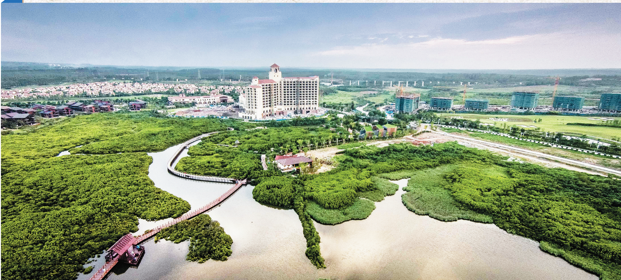
澄迈县富力红树湾生态环境优美