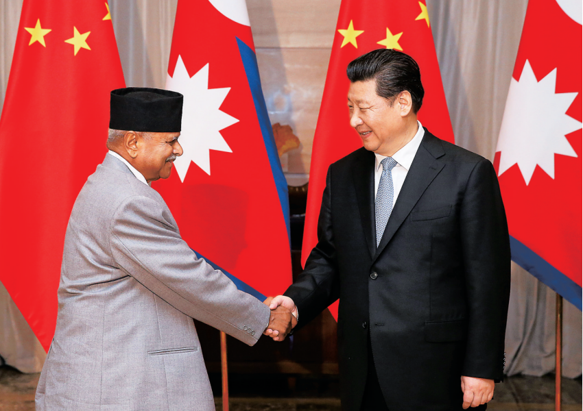
3月28日,国家主席习近平在海南省博鳌国宾馆会见尼泊尔总统亚达夫。

国际风云如何变幻,两国关系始终在和平共处五项原则基础上友好和谐发展,尼方对此感到骄傲。双方在各自关切的问题上相互理解,相互支持。尼泊尔决不允许在尼领土上从事任何反华活动。中国一直支持尼泊尔独立、主权、领土完整,为尼泊尔发展提供道义和物质宝贵支持,尼方