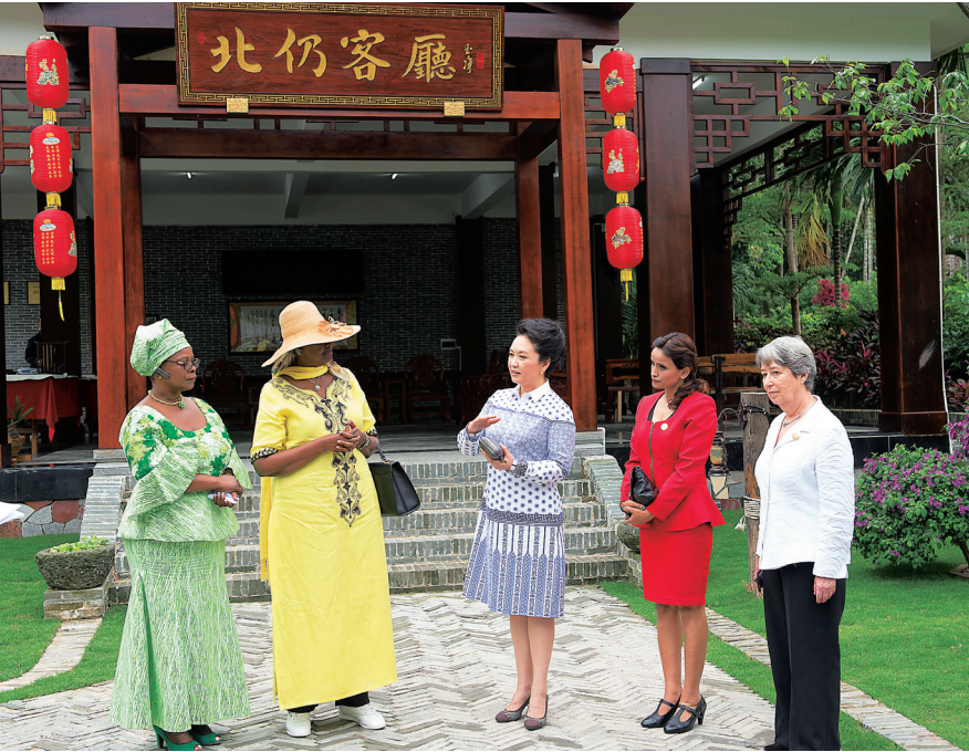
3月28日,国家主席习近平夫人彭丽媛邀请出席博鳌亚洲论坛2015年年会的部分外方领导人夫人参观富有地方特色的海南村庄北仍村。这是彭丽媛向来宾们介绍开放式的传统民居建筑“北仍客厅”。

毗邻万泉河的北仍村是琼海市打造的十大乡村旅游景区之一,80%的村民都参与本村旅游项目经营,实现农业和旅游业融合发展。