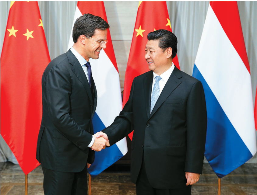
3月28日,国家主席习近平在海南省博鳌国宾馆会见荷兰首相吕特。

吕特表示,习近平主席去年对荷兰国事访问非常成功,有力促进了两国政治和经济往来。威廉-亚历山大国王和马克西玛王后期待对中国进行国事访问。荷兰已决定申请成为亚投行创始成员国,将立即就此同中方沟通。我来博鳌之前率荷兰企业家代表团访问了上海和深圳,企业家们对访问成果非常满意,都期待在中国发展,