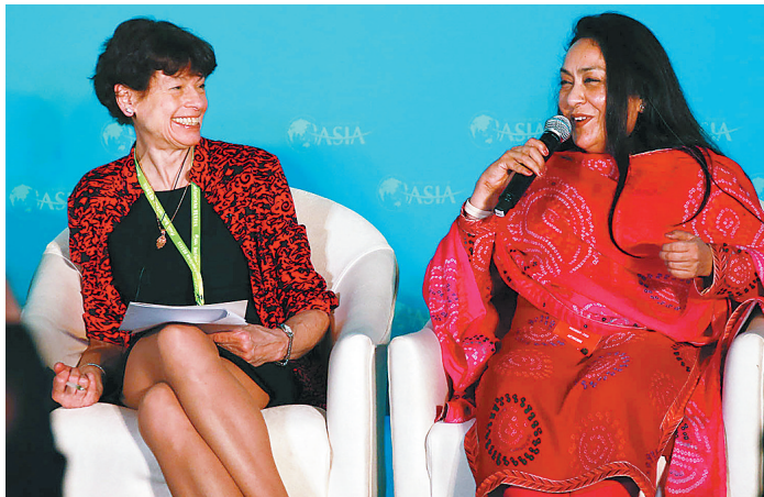
3月28日,“印度经济:重启改革议程”分论坛在博鳌亚洲论坛大酒店国际会议中心举行。图为该分论坛讨论现场。