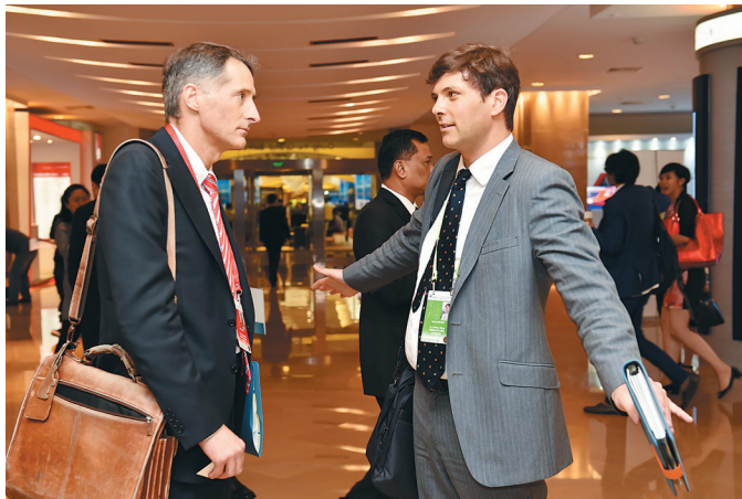
3月27日,“智能医疗与可穿戴设备”分论坛在博鳌亚洲论坛国际会议中心举行。图为两位外国嘉宾在会场外热烈交流。