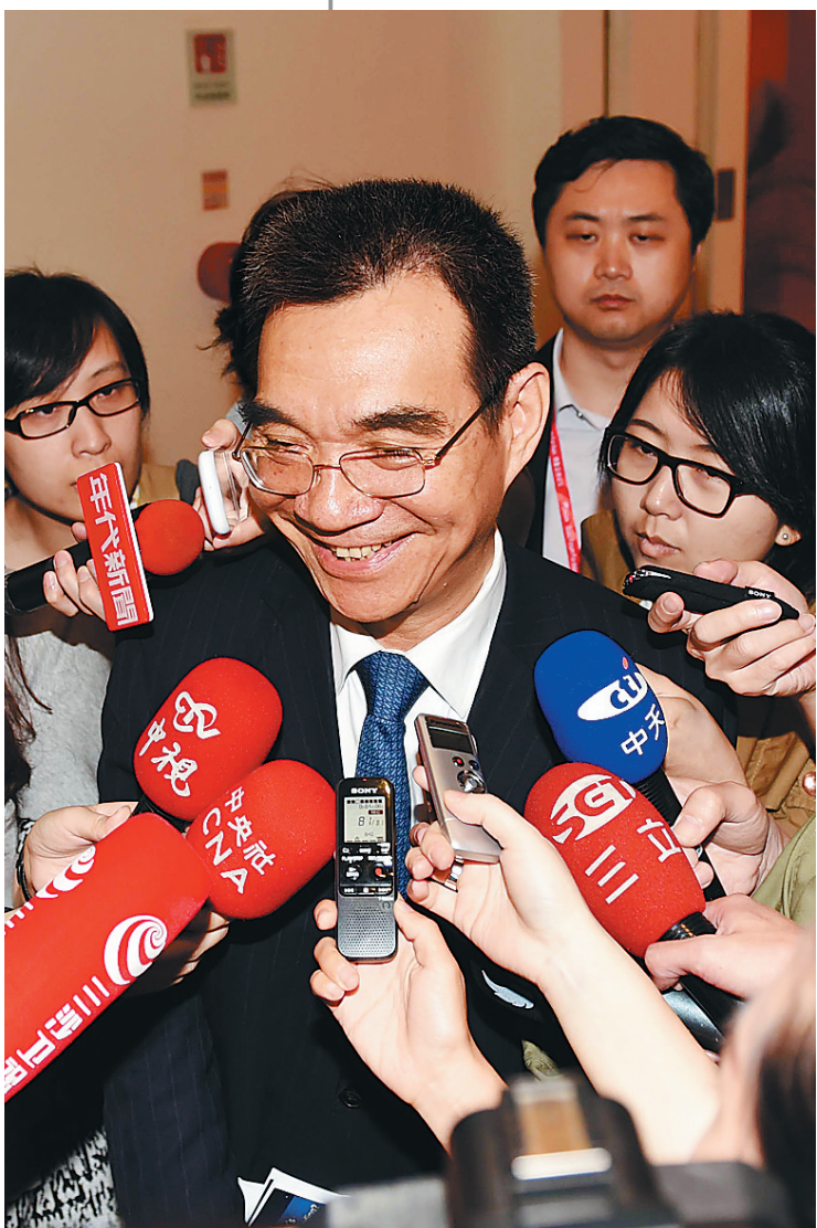
3月29日,参加博鳌亚洲论坛年会的北京大学国家发展研究院教授、名誉院长林毅夫认为,中国GDP达到7%的增长率是最好、最理想的。图为在接受记者采访中的林毅夫。