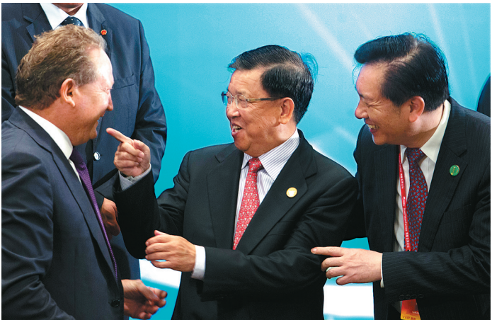
3月28日,龙永图(中)、姜斯宪(右)与澳大利亚FMG集团董事长、明德路集团董事长安德鲁·弗雷斯特(Andrew Forrest)在交流。