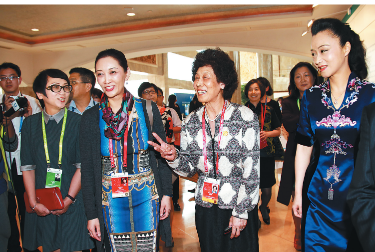
→ 3月27日,来自各国的与会嘉宾,借助论坛大平台,有缘相聚,相谈甚欢。这是与会嘉宾夫人团在欣赏美术展览时相互交流的情景。