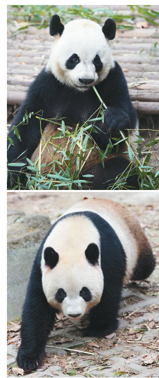
这是三月三十一日拍摄的大熊猫“娅林”和“蜀蓉”。

据新华社成都3月31日电（记者余里）经过3个多月层层选拔，中央政府再次赠送澳门的一对大熊猫于31日最终确定。成都大熊猫繁育研究基地的一对大熊猫“蜀蓉”（谱系编号为667）和“娅林”（谱系编号为726）将于5月初赴澳门定居，接替此前赠澳大熊猫。