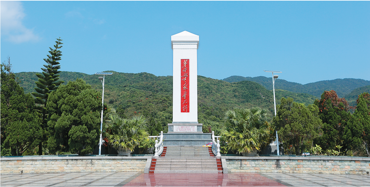
青山脚下的万宁六连岭烈士纪念碑，向牺牲在这里的2000余位英雄致敬。

1927年4月22日，国民党发动反革命政变。23日，万宁县党部委、县农会以“野外演习”为名，夜里率领礼纪、万城、龙滚等农训所近200名学员撤出县城，到六连岭下的军寮村驻营，保存革命力量，从此“三军”会师，建立了六连岭革命根据地，开展了人民武装斗争，实现革命重心从城市转向农村的战略大转移。在中共琼崖地