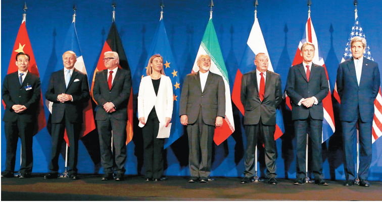
4月2日，伊核问题六国、欧盟和伊朗谈判代表当日在瑞士洛桑发表共同声明后合影。

福尔多核设施停止铀浓缩后，纳坦兹核设施将成为伊朗唯一用于铀浓缩的设施。按照协议，纳坦兹核设施将把现有的1000台第二代离心机交由国际原子能机构监管。先进离心机的研发