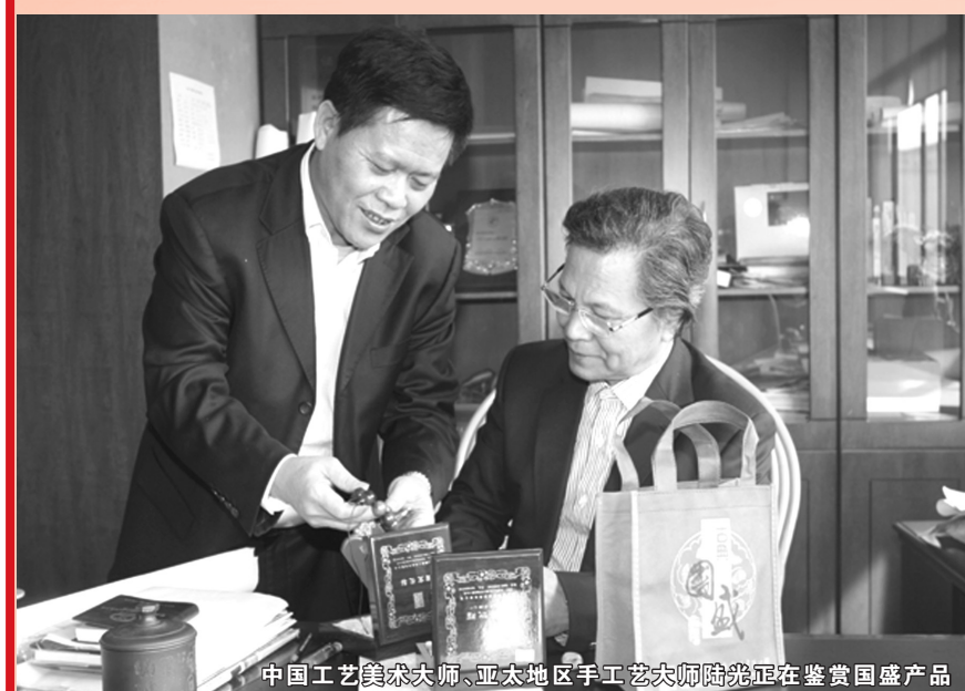
中国工艺美术大师、亚太地区手工艺大师陆光正在鉴赏国盛产品