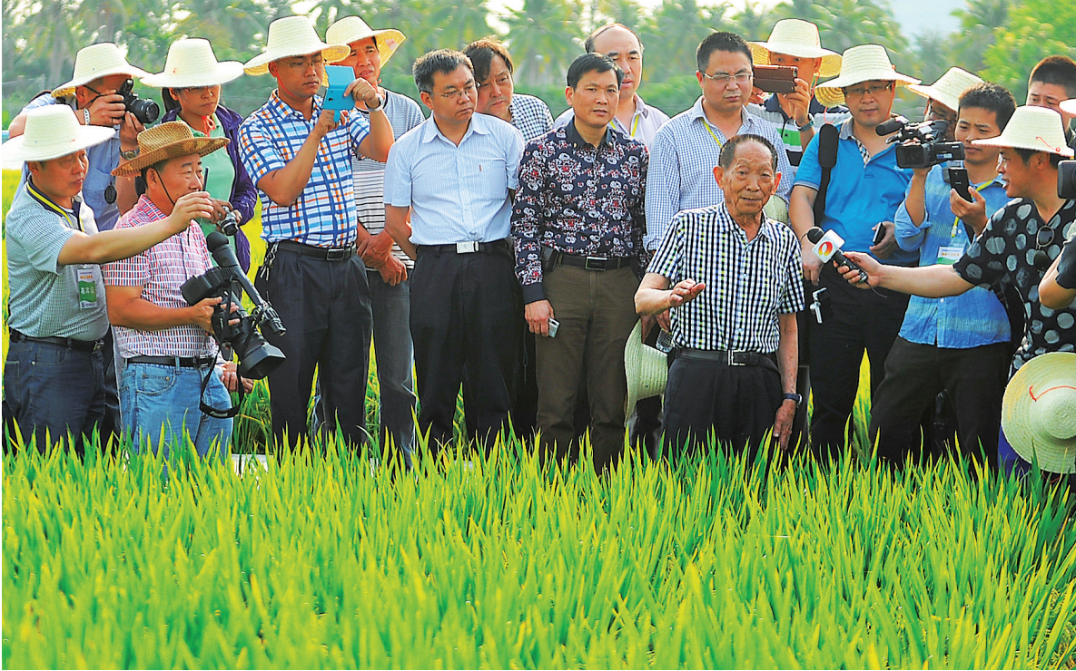
4月9日，袁隆平院士带领农业部及国内17个省份200多名专家，参观了位于三亚海棠湾等地的多处高产杂交水稻试种基地。