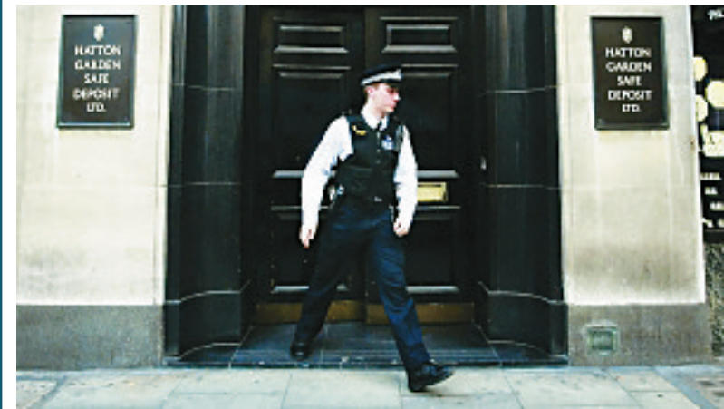
一名警察在案发现场。