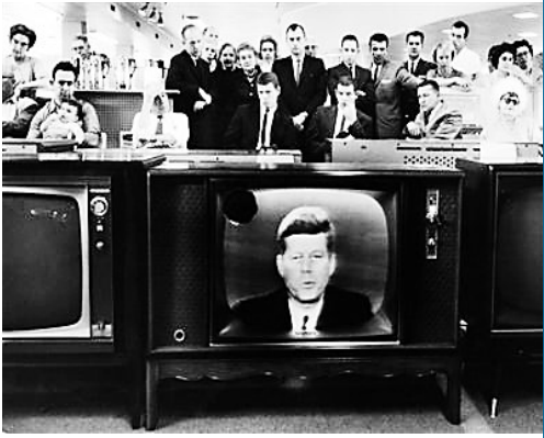
1962年,古巴导弹危机,时任美国总统肯尼迪发表电视讲话。

现年83岁的劳尔·卡斯特罗去年明确表示,将于2018年任期届满后退休,同时希望自己任内帮助古巴成功