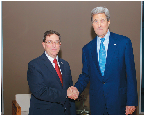
2015年4月9日,在巴拿马首都巴拿马城,美国国务卿约翰·克里(右)与古巴外长布鲁诺·罗德里格斯握手致意。

地走上改革道路。古巴前外交官卡洛斯·阿尔苏加赖认为,与美国实现关系正常化不可避免引起古巴国内一些保守派势力的反对,但作为古巴革命重要领导人,劳尔·卡斯特罗有足够威望应对这些不同声音,而他的继任者恐怕没有这个能力。因而,与美国尽早改善关系符合古巴的利益。