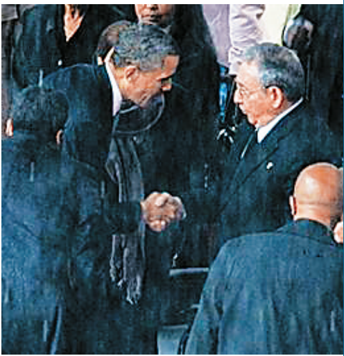
美古领导人在曼德拉追悼会上握手。