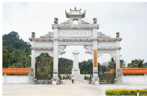
位于琼中的白沙起义纪念馆。为纪念黎族领袖王国兴带领黎族苗族人民白沙起义而建。

1949年夏,王国兴受党中央之邀,到北平参加政治协商会议,并当选为全国政协第一届委员。9月21日,在中国人民政治协商会议上,王国兴激动地说:“过去的统治者把少数民族当做奴隶,今天共产党让我们少数民族讨论国家大事。只有跟着共产党,跟着毛主席,才能前途光明灿烂!”