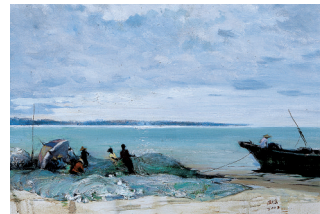
《故乡的海》油画 王家儒