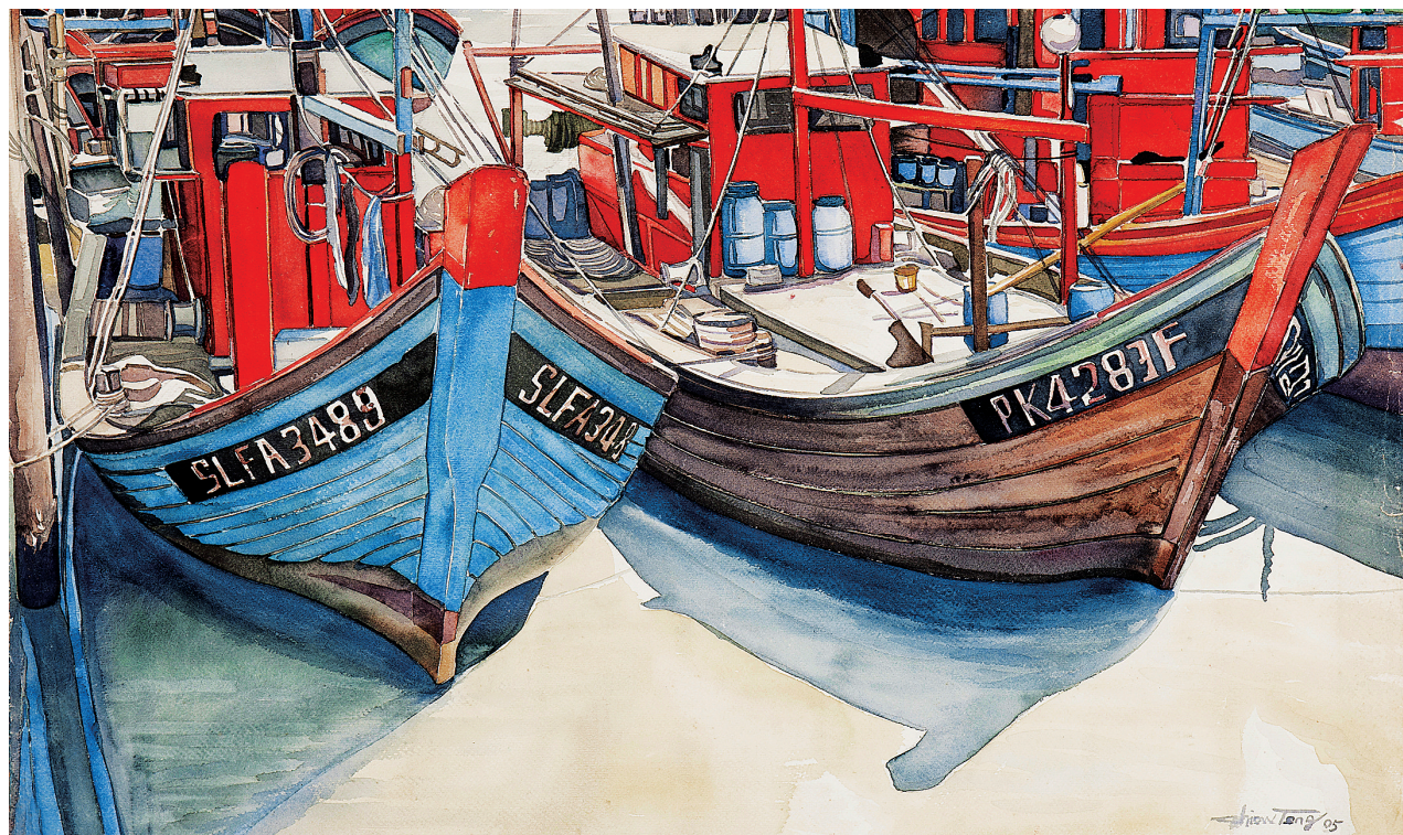
《沉静的午后》油画 曾昭承(马来西亚)