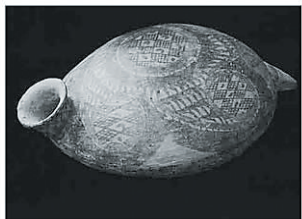
195 电灯的形陶罐 2006年 北京

史上第一本韩国主题旅游书。本书以奔跑吧兄弟韩国原版综艺剧情为主线,超强解析100个以上跑男fans必朝圣任务场景,是旅韩背包客&资深跑男粉不可错过的收藏之作!超干货的文字+辨识度高的图片,誓破旅行书文艺的不实用、实用的不时髦、时髦的不接地气的大魔咒,随便翻开每一页都能找到你想去的景点,随便瞄一瞄就能立即知晓旅行路线。