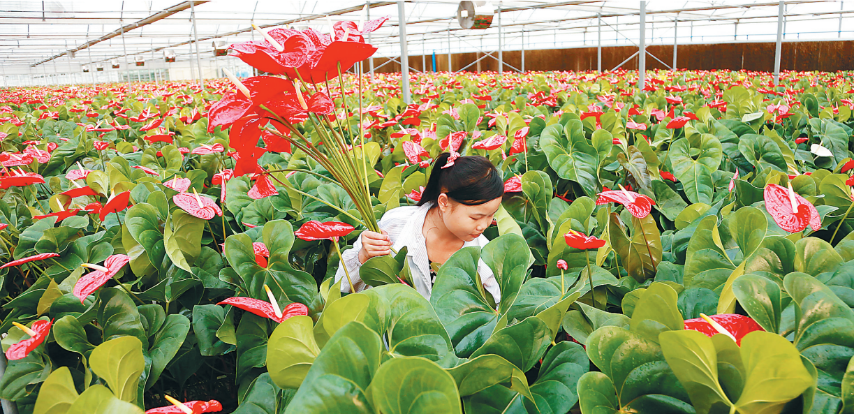
东方市小岭农民专业合作社发展设施农业,产品畅销全国并出口至日本、韩国、俄罗斯。

他的小岭农民专业合作社2008年成立,吸引大量村民来打工。汤天贵说,当时,最多的时候一天就有300人来