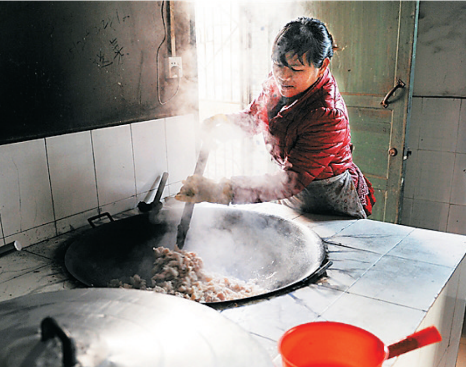
左图：部分学校食堂硬件十分落后，管理亟待完善。 右图：思源学校的食堂管理有许多经验值得借鉴。