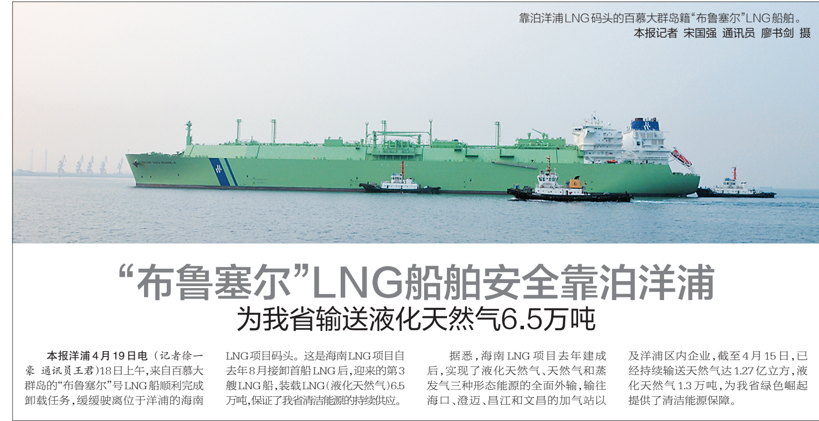
靠泊洋浦LNG码头的百慕大群岛籍“布鲁塞尔”LNG船舶。

“七不准”包括：一是不准未批先建。二是不准抢修抢建。三是不准包庇纵容。不得对职责管辖范围内的违法建筑不管不问，放任发展，酿成严重后果。四是不准欺瞒硬泡。不得在整治工作中，消极对抗，甚至暴力抗法。五是不准说情干扰。六是不准跑风漏气。不得在依法依规行动中，阳奉阴违，跑风漏气、通风报信。七是不准以权谋私。不得利用职权为亲属、子女和身边工作人员搞违法建筑提供便利条件。