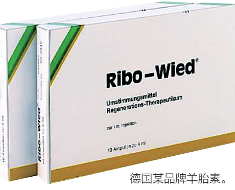
德国某品牌羊胎素。

虽从科学上证实可防止器官、骨骼及关节等出现问题,但这并不是抗衰老治疗。 记者张森(新华社日内瓦4月18日电)