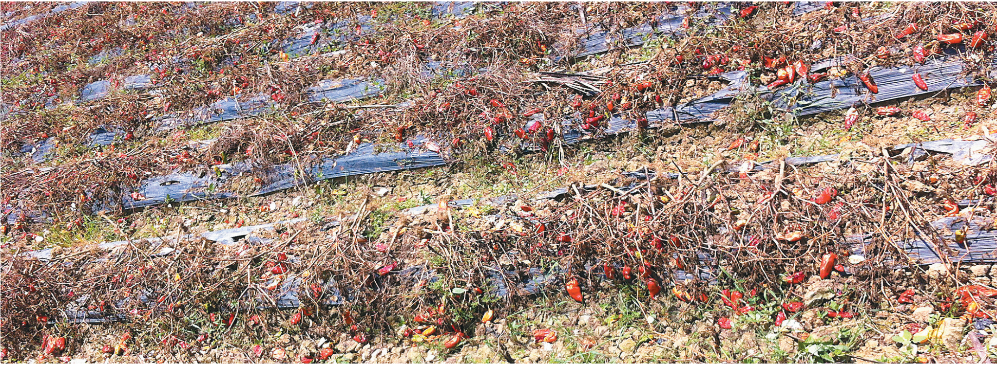
我省部分市县辣椒价格跌破成本价，很多农户任其烂在地里。