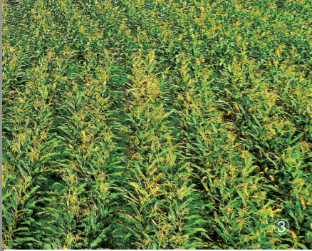
海南黄瓜、青椒、玉米今年出现价跌。