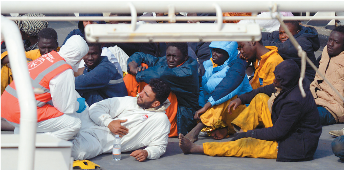
4月20日，在马耳他森格莱阿市，沉船幸存者坐在意大利缉私船“格雷戈雷蒂”号的甲板上。