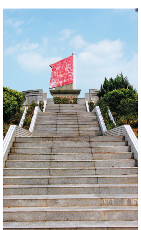
美合革命根据地纪念碑。

星星之火可以燎原。尽管琼崖抗日根据地处于敌强我弱的不利形势之下，但各根据地依托强大的群众力量，独立自主地开展敌后游击战争，积小胜为大胜，让日军占据海南岛的幻想破产。