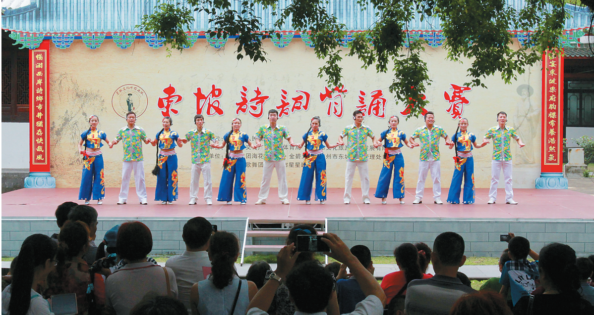
儋州「星星歌友会」调声队表演儋州调声。