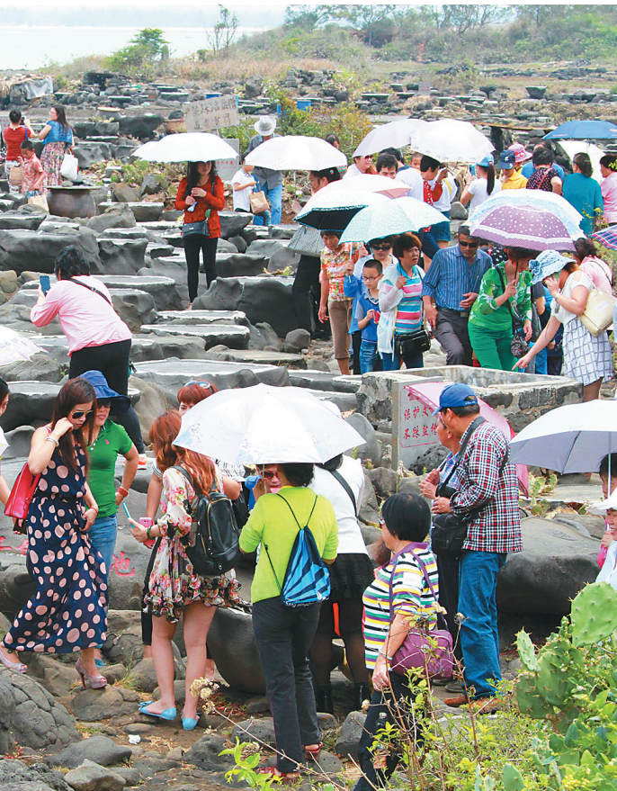
洋浦千年古盐迎来众多游客。