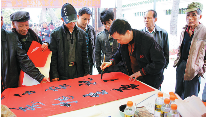
书法爱好者现场挥毫献艺。

儋州市长张耕表示，儋州已步入快速发展的轨道。要想推动经济社会持续增长，必须找准总抓手，启动“东坡文化体验之旅”就是总抓手的切入点。因为旅游业是关联性很强的产业，一旦良性循环，将带动上中下游产业的发展。（平宗 振安 黄洋）