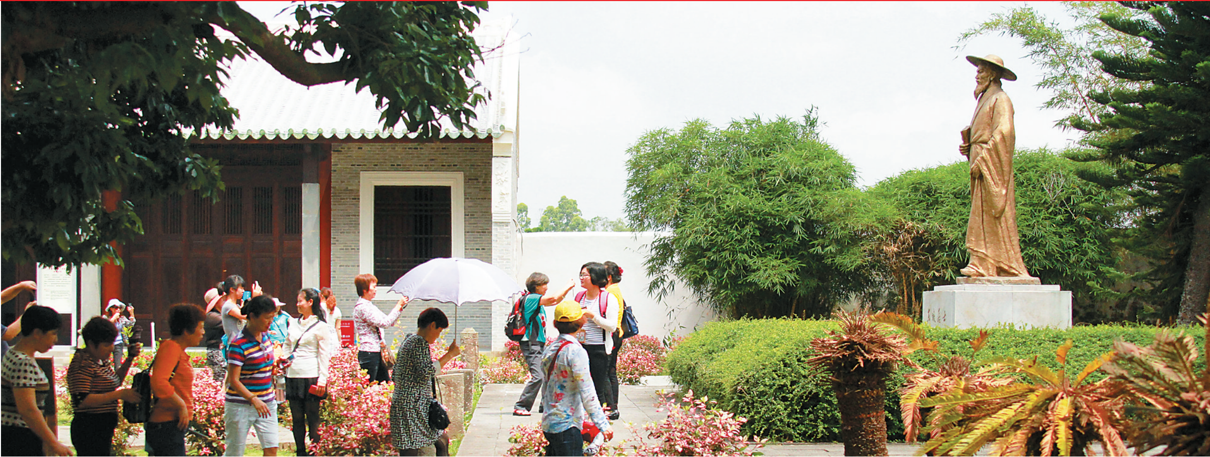
东坡书院游人如织。