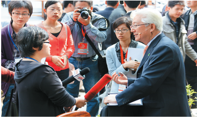
著名央视节目主持人陈铎在东坡书院接受采访。