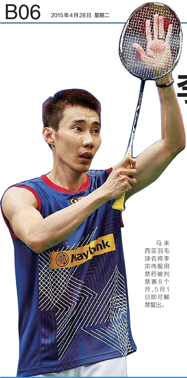
马来西亚羽毛球名将李宗伟服用禁药被判禁赛8个月,5月1日即可解禁复出。

新华社马来西亚普特拉加亚4月27日电 马来西亚青年与体育部长凯里27日在普特拉加亚市召开新闻发布会宣布,该国羽毛球名将李宗伟服用禁药被判禁赛8个月,5月1日即可解禁复出。 凯里说,根据国际羽联的通知,李宗伟禁赛期从2014年8月30日开始,禁赛8个月,5月1日解禁。他强调,相