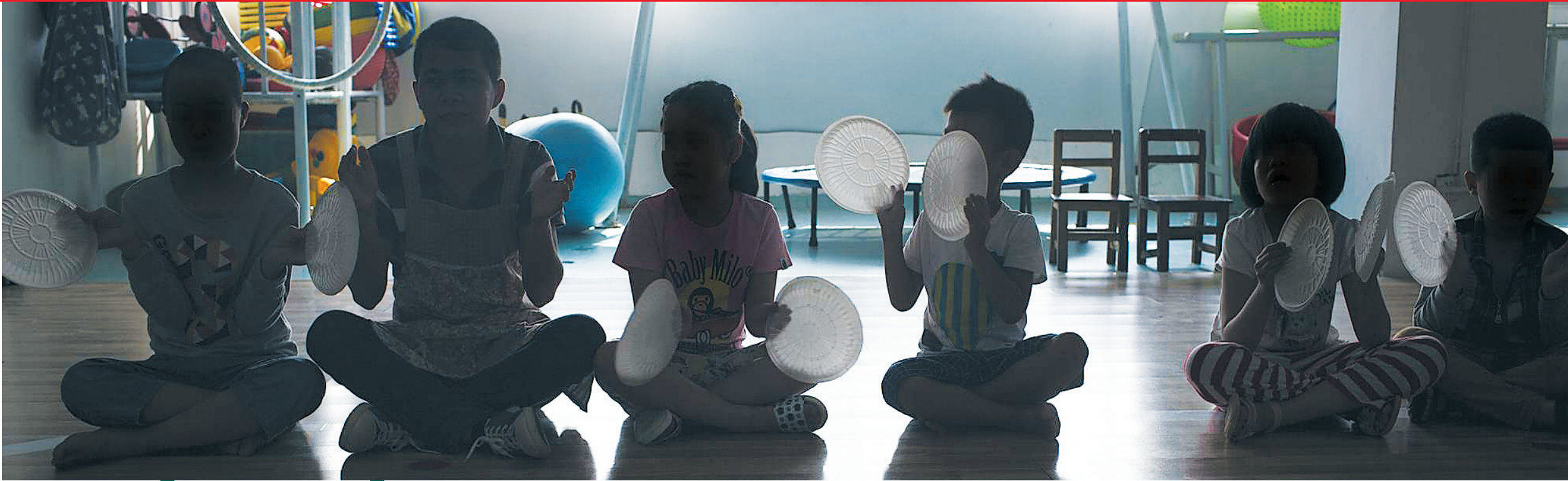
四月二十七日，海口天翼特教培训中心，老师在给孩子们上课。