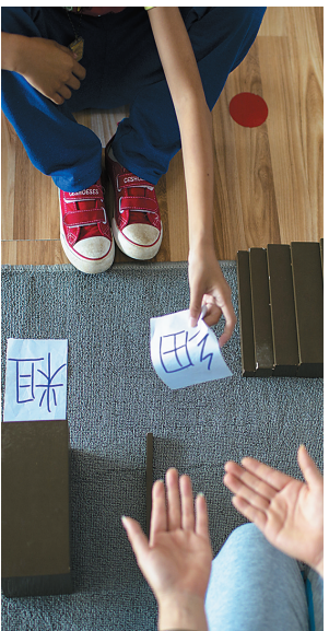
海口天翼特教培训中心,老师在给孩子们上课。

全省在编在岗特教老师仅200人,专业教师缺乏;更面临工资低、压力大、招不来、留不住的窘境