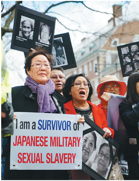
4月27日,在美国马萨诸塞州的哈佛大学肯尼迪政府学院外,抗议者手举标语,要求日本首相安倍晋三就“慰安妇”等日本二战罪行道歉。

未就“慰安妇”等日本二战罪行直接道歉 安倍哈佛演讲遭抗议 新华社美国马萨诸塞州剑桥4月27日电 (记者周而捷 刘帅)数十名抗议者27日聚集在哈佛大学肯尼迪政府学院外,要求日本首相安倍晋三就“慰安妇”等日本二战罪行道歉。 正在美国访问的安倍当天在哈佛大学发表演讲。演讲厅外,包括哈佛大学学生和韩裔美国团体成员在内的抗议者手举标语,高喊口号,要求安倍停止否认历史事实,明确就日本军队二战暴行道歉。 曾被日军掳做“慰安妇”、现年87岁的韩国二战幸存者李容洙在抗议现场对记者表示,安倍公然否认日本军队在二战期间犯下的暴行,她作为幸存的历史见证者,强烈要求安倍停止谎言、正视历史。 当天,安倍在演讲后的问答环节中声称,他曾表示将会继承日本官方在“慰安妇”问题上的表态,他在这一问题上的态度与往届日本首相并无不同,但他并未就“慰安妇”等日本二战罪行直接道歉。 安倍在历史问题上的态度遭到不少美国民众的抨击和质疑。哈佛大学学生学埃里克·戈拉尔在安倍演讲后对记者表示,安倍很明显在逃避听众提出的“慰安妇”问题,安倍的回答令他“相当失望”。 安倍26日抵达美国波士顿,开始为期一周的访美行程。他将在28日与美国总统奥巴马在白宫会谈,并于29日在美国国会发表演讲。