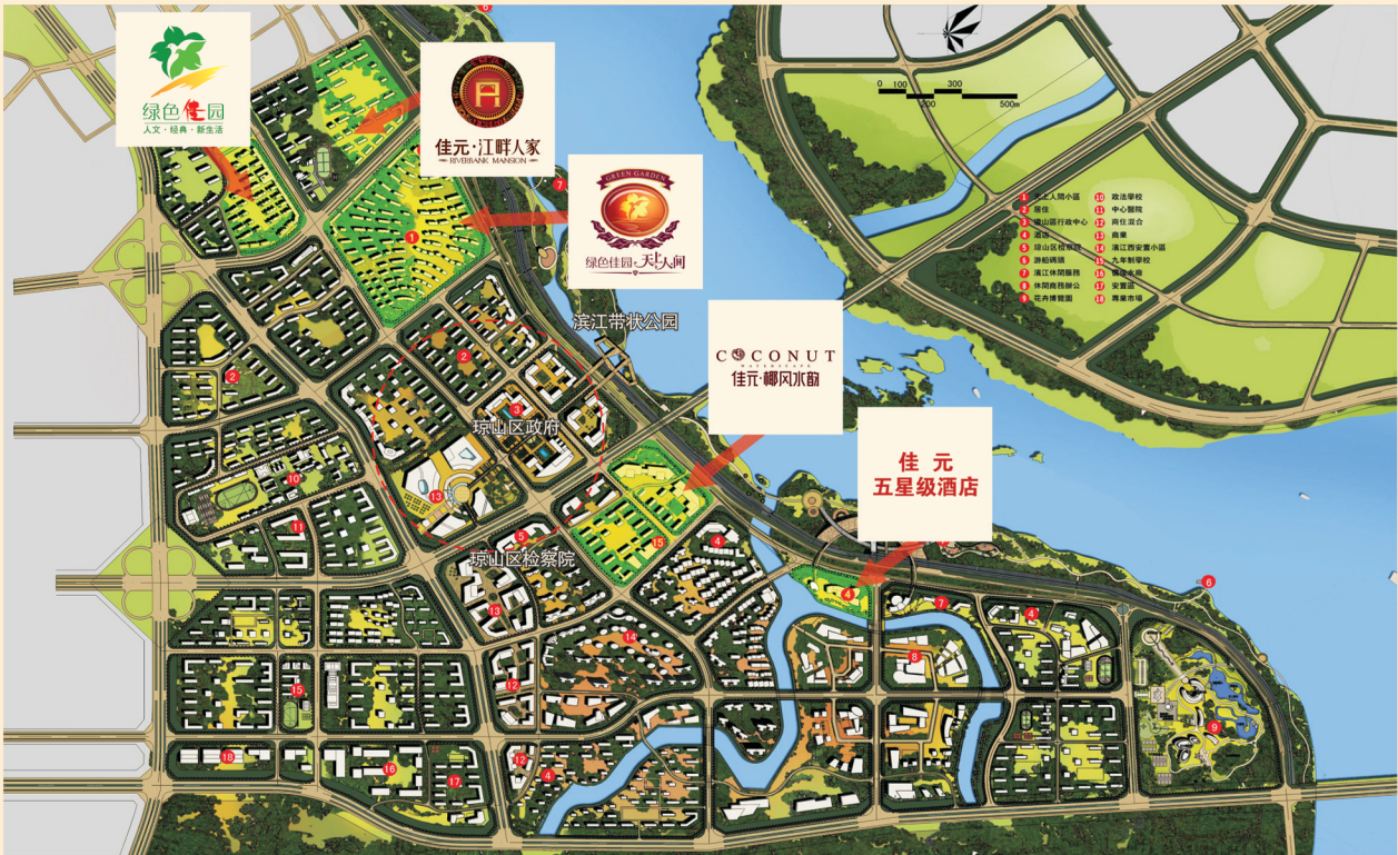
滨江新城佳元地产项目分布图