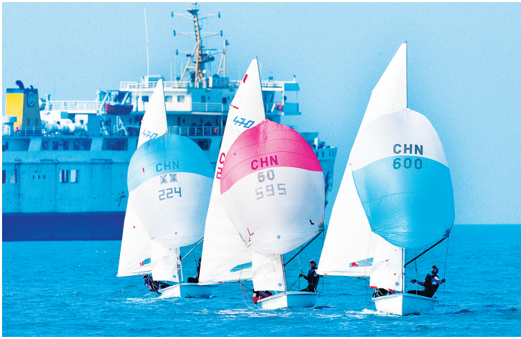
海口水上运动蓬勃兴起。