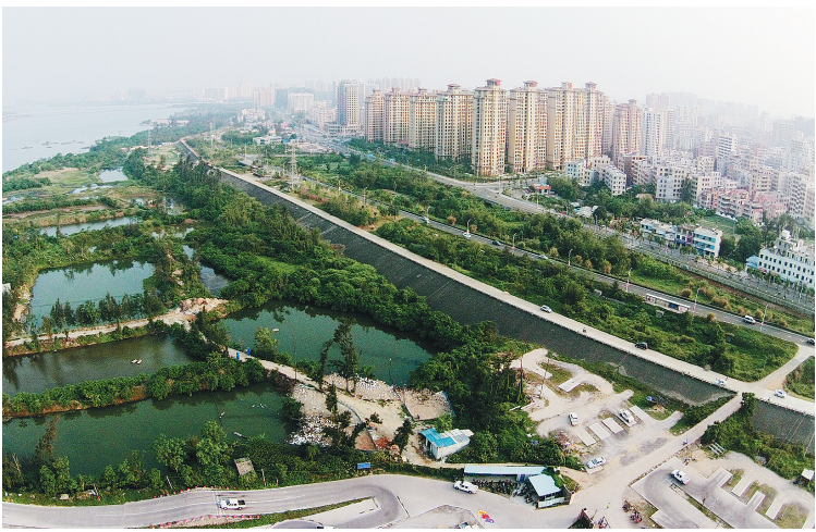
航拍海口南渡江畔景观。本报记者 张杰 摄