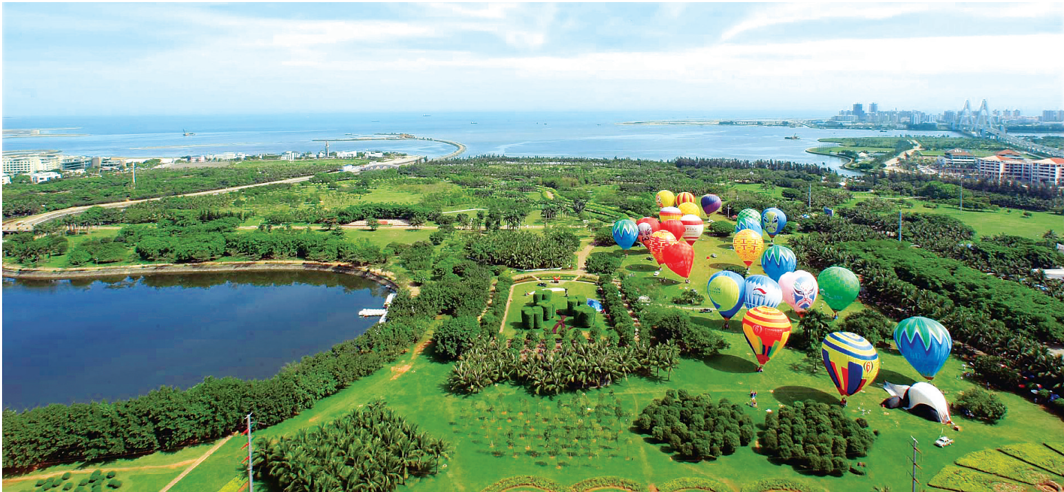
海口万绿园是市民游客喜欢的休闲好去处。

在对市场的监管方面,海口采取预扣5%预售商品房面积的形式,建立商品房质量与履约担保制度,直到该项目办理初始登记后方能销售。此外,海口加快了城镇保障性住房建设,积极稳妥推进棚户区改造工作,确保海口房地产平稳发展。