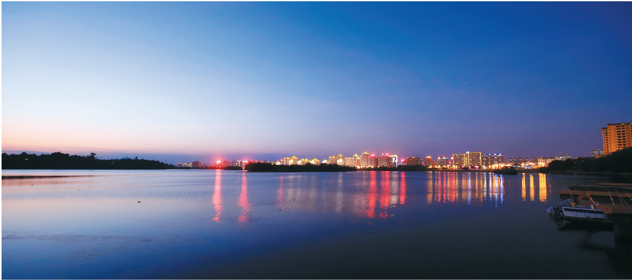
万泉河美景如画。

“在海南全省各市县中，琼海的区位优势 and 自然条件都不是最好的。琼海不能和海口比大，不能和三亚比海，如何找到适合自己的发展之路？”琼海市委书记符宣朝说，经过一番思考和论证，2012年琼海市委、市政府确定了“打造田园城市、构建幸福琼海”的发展思路，即在城镇化建设过程中，不走规模扩张型的老路子，而是在不改变农民