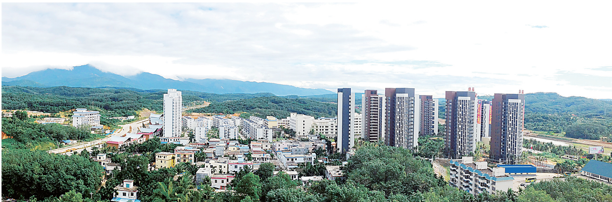
保亭毗邻三亚，具有明显的区位优势。

位于七仙岭脚下的龙湾雨林谷，是保亭较为高端的楼盘。“我们的楼盘地理位置优越，地势高，能看到七仙岭的全貌，周边就是村庄，美丽田园就在眼前，距离保亭县城也比较近。”龙湾雨林谷楼盘销售主管王丹告诉记者，那些独栋花园洋房都是温泉入户，还有2000平方米会所，为业主提供高端健身、医疗等服务。