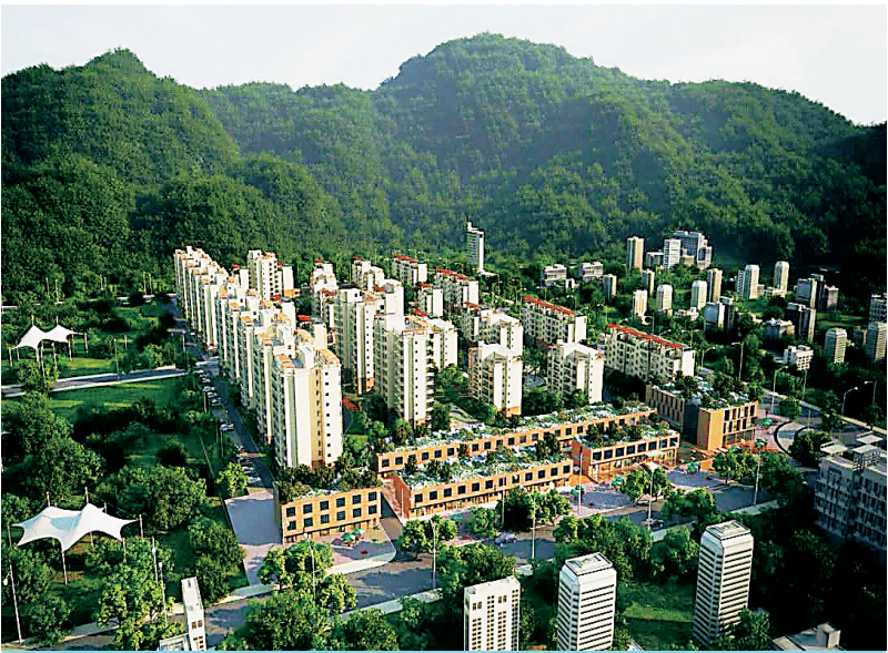
昌江恒基·御南山项目。