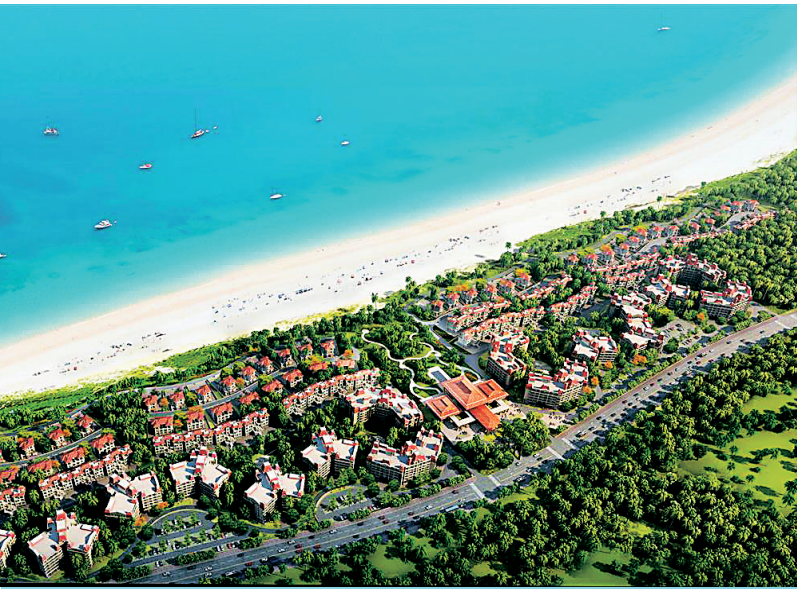
昌江恒大棋子湾项目。