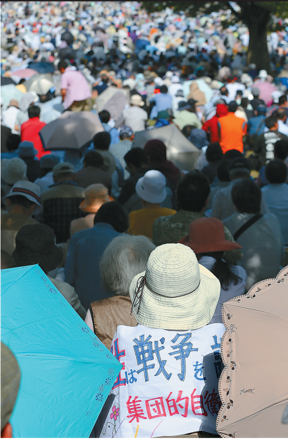
数千日本民众抗议安倍企图修改和平宪法

5月3日，在日本横滨，身披“不需要战争，反对集体自卫权”标语的示威者参加和平集会，抗议首相安倍晋三企图修改和平宪法。