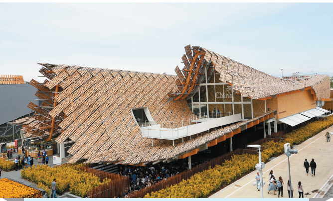
国家馆：演绎农耕历史

雨过天晴，又逢周六，米兰世博园迎来开园第二天。中国国家馆、中国企业联合馆和万科馆，以“食”为主线串联古今，吸引来自全球的游客前来了解中国农业、粮食和悠久饮食文化的历史、现状及未来可持续发展的理念。