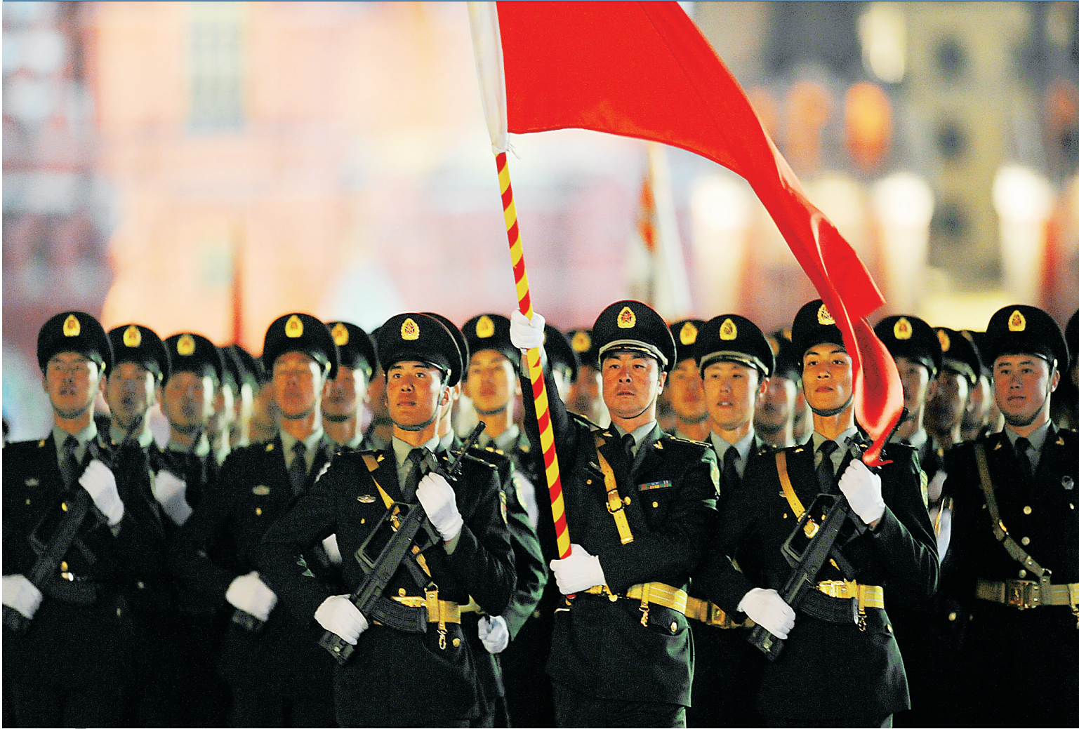
科，中国方阵参加彩排。 ↑五月四日，在俄罗斯首都莫斯科，中国方阵参加彩排。