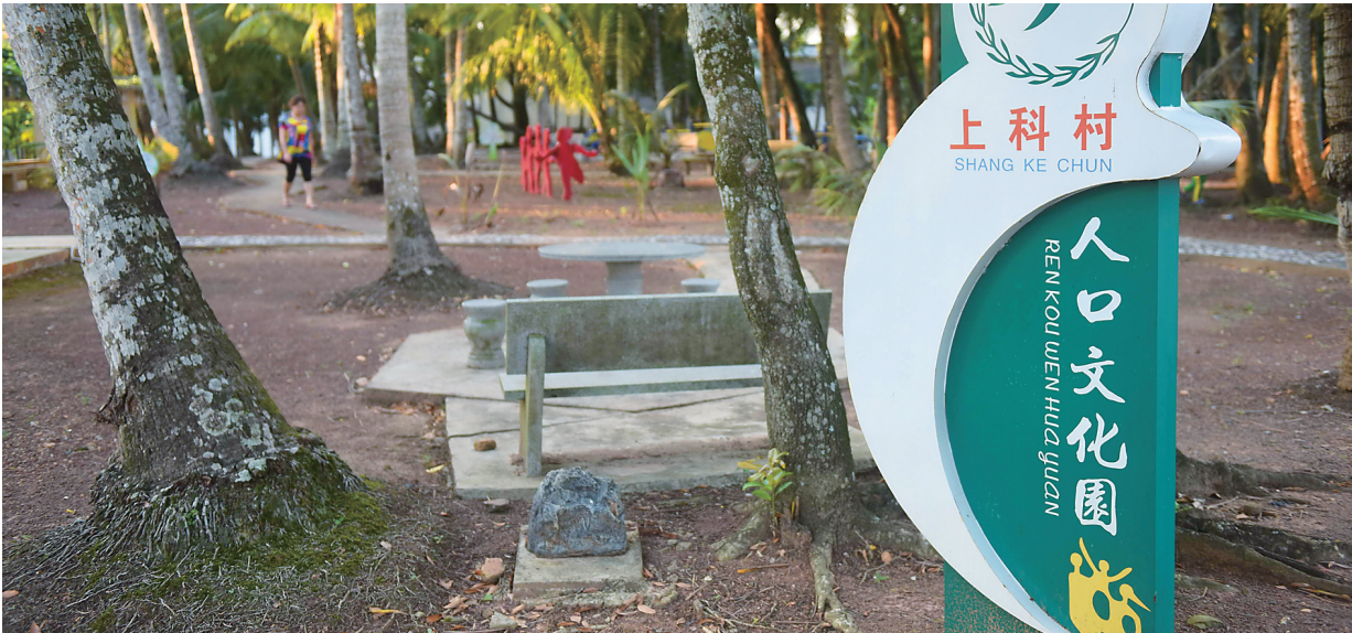
琼海阳江镇上科村人口文化园。

革命老区琼海市阳江镇上科村,用88年的实践证明了一个真理——不论是革命年代还是建设时期,坚强的基层党组织,坚定的红色信念,始终是老区发展的动力源泉。