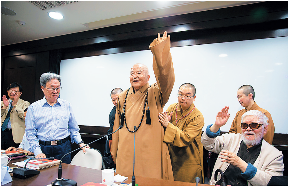
星云大师为笔会嘉宾进行了演讲。

“写意美之岛 相会阳明山”2015两岸笔会于5月6日至11日在台湾举行。来自内地、台湾、香港、澳门的70多名作家、画家、书法家、摄影家相会台湾岛，携手采风，联袂创作，交流切磋，用笔头、镜头展示台湾的自然之美、人文之美。一周的行程即将结束，名家们彼此畅述心怀，展望未来，海南岛台湾岛两岸文化交流取得丰硕果实。