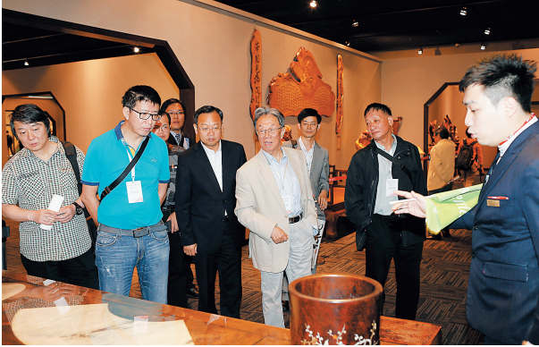
与会名家参观台北昇恒昌森磊中华传统文物展览。

时候是个“傻大兵”，身边的同学混得很好，而他从部队走出来后要一切重头开始。“当官无望，走技术路线也不行，那时的我，感觉就只有一条道路——写作。而当你写成之后，自己的名字被印刷成铅字之后，你开始有了野心。”