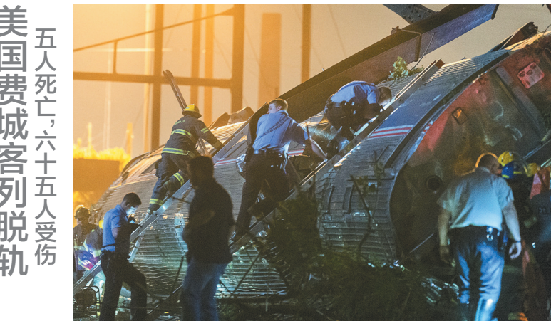
五人死亡,六十五人受伤 美国费城客列脱轨

那名消息人士说:“服役期间,由于不适应军营生活,他几次被调岗……医疗记录显示,他因抑郁接受过治疗。” 安晓萌(特稿·新华国际客户端)