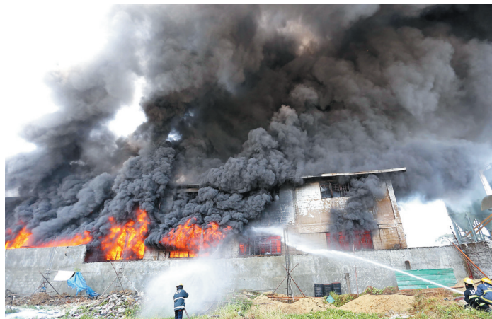
菲律宾工厂大火 三十一人死亡

5月12日,在美国费城附近,救援人员在列车脱轨事故现场搜寻伤者。当日,美国费城附近发生客列车脱轨事故,导致车头及6节车厢脱轨。事故已造成至少5人死亡,65人受伤,其中6人伤势严重。