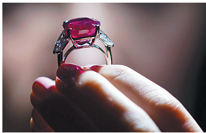
在英国伦敦苏富比拍卖行,一枚鸽血红的缅甸红宝石刷新了红宝石拍卖价的世界纪录。

对于艺术品拍卖价格逐年升高的趋势,业内专家分析,艺术品市场的繁荣使全球私人收藏者的数量不断增加,而艺术品的投资价值以及新老藏家对优秀作品的追求又推高了艺术品价格。他们预计,这一艺术品拍卖价格走高的趋势还将持续。 刘曦(特稿·新华国际客户端)