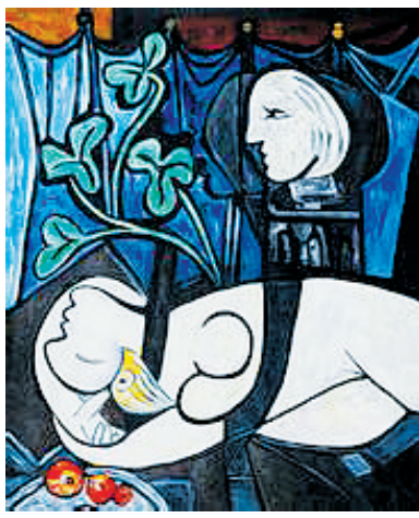
《裸体、绿叶和半身像》