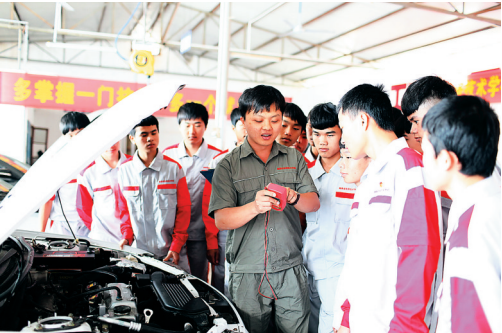
海南省经济技术学校的老师给学生上实践课。