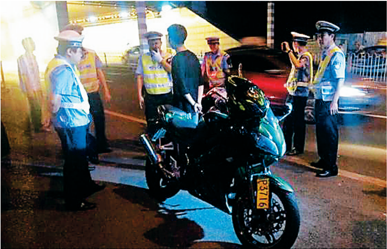
交警正在查处一起涉嫌夜间“飙车”行为。

经过摸排了解，基本掌握市区“飙车”违法行为基本情况，“飙车”者主要为16岁至20岁左右的青少年，而“飙车”多使用摩托车（或改装）、改装电动车，也有小汽车，主要集中路段为龙昆南路、滨江路、碧海大道、南海大道、滨海大道等主干道，时间多在凌晨之后。