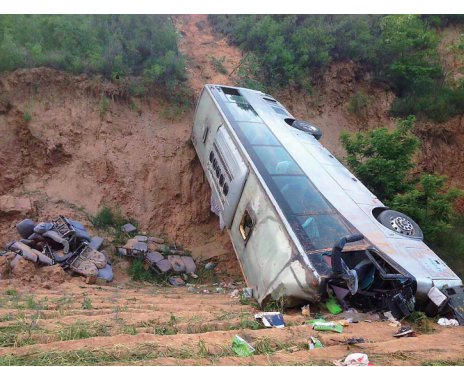
事故现场。

新华社西安5月15日电（记者陈晨 石志勇 陈昌奇）记者15日晚从陕西省淳化县特大交通事故现场获悉，当日下午发生坠崖的车辆为西安相伴商贸有限公司雇用的旅游车辆，目前已造成35人死亡，11人受伤。初步调查显示，事故发生的原因车辆弯道操作失误。 据当地有关部门介绍，15日15时27分，西安相伴商贸有限公司雇用的4辆大巴车，行驶至淳化县淳卜路2公里+450米处，其中一辆大巴车失控坠崖。当时4辆大巴车内共有193人，坠崖的大巴车核载47人，实际乘坐46人，含2名司乘人员。 记者15日晚9时许在事故现场看到，出事车辆倒在深沟内，一部分车身还悬靠在山坡上，不时有石块、土块滚落。车内座椅大多数已被甩离车体，只有少数几个仍悬在车内，车辆周围散落着鞋帽、衣服、水杯等生活用品，现场血迹斑斑。发生坠崖的地点为通山公路一拐弯处，弯道较急，道路上还有车辆刹车时留下的痕迹。