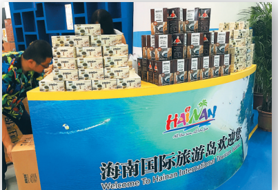
文博会上海南展厅的展品。