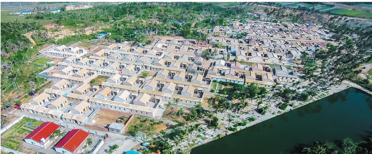
文昌昌洒镇白土村。

在文昌市昌洒镇东群村下辖的白土村,人们会疑惑:这里是老村,是新村,还是景区?白土村往北五六公里的滩涂边,便是赤水港,当年解放军渡海先锋营登陆海南的第二个点。一座“先锋营登陆地点纪念碑”面朝大海,静静地守候着这片当年被血与火洗礼过的岸滩。 这个极富现代化又清新恬静的小村,几十年前以英勇无畏的精神积极配合党的革命工作、甘当堡垒户,十多年前以勤劳的双手发家致富,一年前以顽强的精神在台风中涅槃重生……世代传承的意志,让老村变成了新村。