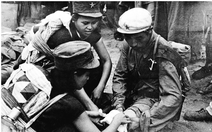
琼崖纵队女战士为受伤的指战员包扎伤口。

由于年代久远，一些照片的拍摄地点已经无法确认，留给后人更多的猜测和悬念，但历史的真实感却毫无削减。