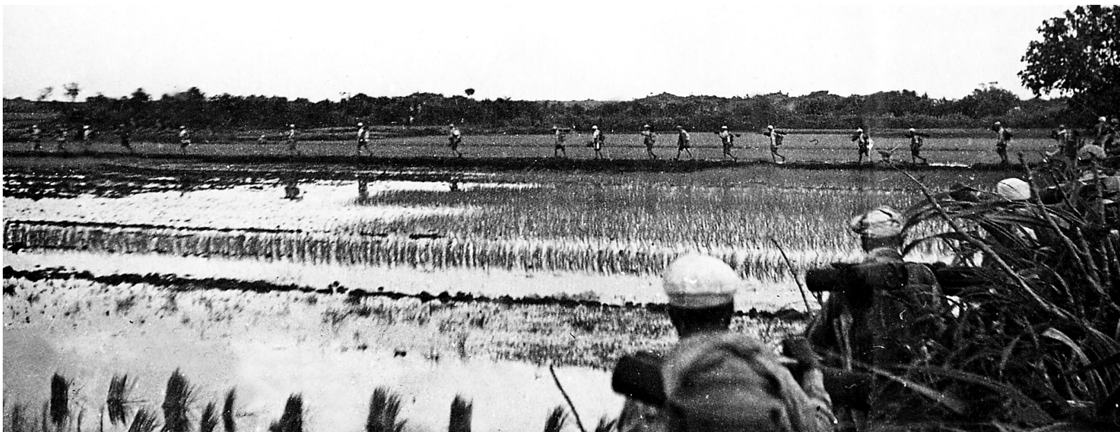
增援部队通过稻田向预定地点挺进。