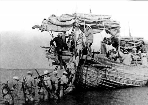
从海北登船，准备向海南进发。