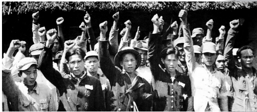
琼崖纵队克服重重困难，偷渡输送船工过海，对引导渡海大军登陆和大举渡海登陆成功，起到了重要的作用。