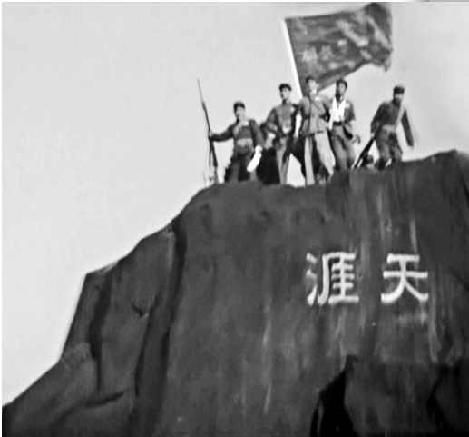
解放军将红旗插上“天涯”、“海角”。