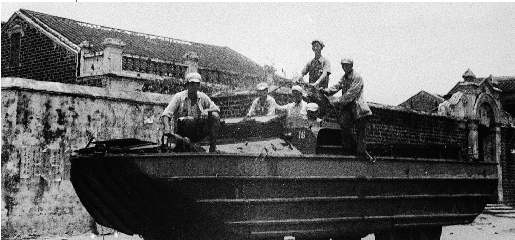
缴获国民党军队的海陆两用车。