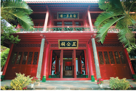
海南第一楼——海口市五公祠。