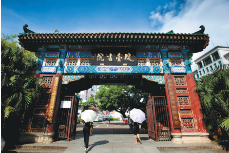
海口市琼台书院。

备受关注的海南第一高楼“海口塔”终于有了确切的开工建设时间。海航集团近日向媒体透漏,该项目已完成超限审查及初步设计,项目正在进行试桩工作和技术方案招标,并计划5月底开工建设。 以“莲花”为设计概念的“海口塔”建成后地面94层、高度为428.3米,被誉为“海南新地标”,其拟建消息一经传出,就引发海口市民的广泛关注,也勾起了大家对海口市那些老地标性建筑的回忆。 地标可谓是一个城市的象征,是大家最耳熟能详的地方,也是市民最乐于谈论的话题,更是游客最先拜访的地方,是保留城市记忆最多的建筑,回顾海口建城后,特别是近一百多年城市地标的变迁,一座口岸城市的万种风情不禁迎面扑来。