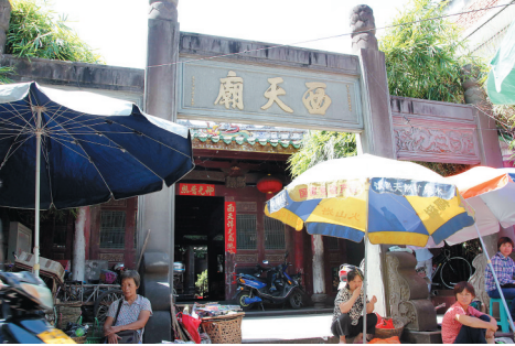
海口市义兴街西天庙。